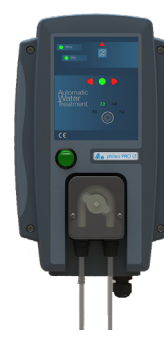
phileo pro lt